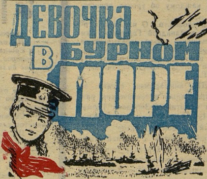
Рис. Л. СМЕХОВА.

— Экспресс ми*, — пробормотала Елизавета Карповна и, взяв иглу с шёлковой нитью, стала накладывать швы.